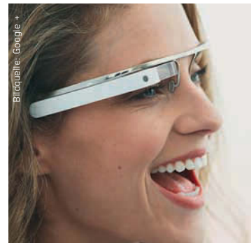
Googles Project Glass

Während Facebook mit dem Wert seiner Aktie kämpft, startet der Suchmaschinenriese Google einen neuen zukunftsweisenden Service: Project Glass.